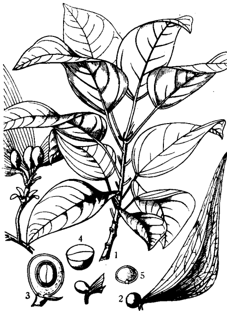
图2 圆粒苹婆 Sterculia scaphigera Wall. (Pierre, Fl. For. Cochinch. III.)

2. 圆粒苹婆 Sterculia scaphigera Wall. 2,3,4,5) (图2, 图3: 4—6) 叶为卵形或椭圆披针形。果实为蓇葖果。种子为卵圆形或近球形,长1.8—2.5厘米,宽1.6—2.2厘米,黑褐色,表面具细皱纹而较密;种脐位于腹面的下方,色淡;种皮有3层: 表层极薄,中层(种衣)较厚,黑褐色,胶质状,浸水后很慢膨胀,仅能达到原体积之4倍,内层革质,韧性强,包着种仁,外表黑褐色,粗糙,具极细密的皱纹,没有胚乳;子叶肥厚,圆形,腔小,不明显,以手摇之滚动;胚根小,呈钻形,位于子叶的弯缺口内,而其顶尖露出缺口的外边并与种脐相接。