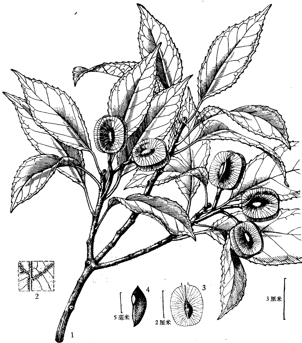
桂滇桐 Craigia kwangsiensis Hsue sp. nov.